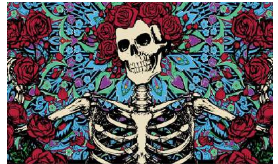
Grateful Dead (1967- '95)