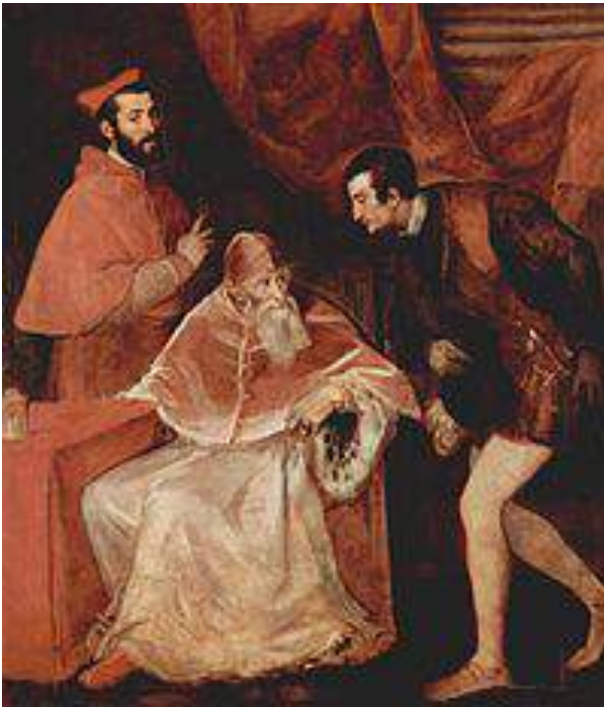
Paulo III Alessandro Farnese (1468-1549)