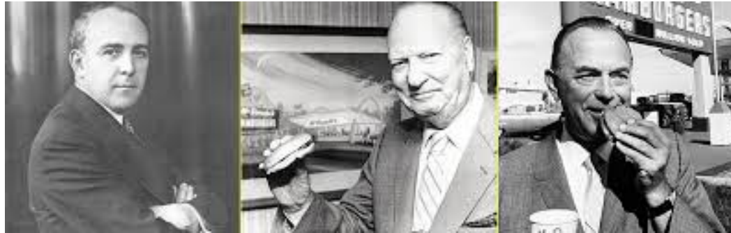
Richard y Maurice McDonald y su socio, Ray Kroc