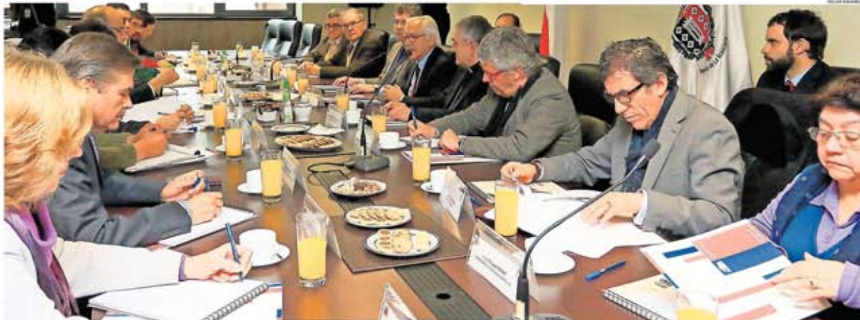
POR MÁS DE DOS HORAS EL COMITÉ POLÍTICO DE LA PRESIDENTA MICHELLE BACHELET ESTUVO REUNIDO CON LOS INTEGRANTES DE LA MESA DE DIÁLOGO.