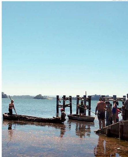
DISTINTOS ENFOQUES Y EXPERIENCIAS TURÍSTICAS SERÁN EXPUESTAS.