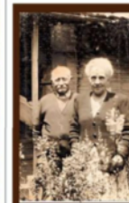
FAMILIAS FORJADORAS DE LA REGIÓN

"Se hizo una promesa en base a un escenario que no se dio". Págs. 4y 5