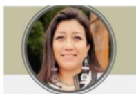
Carolina Huenupan Jemenao

Actual senadora por la circunscripción 11 Región de La Araucanía (Independiente-RN). Fue directora de Serotec y ocupó cargos ligados al ámbito agrícola en los municipios de Nueva Imperial, Lumaco y Traiguén. También fue docente en Inacap y en la Corporación Metodista.