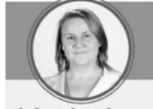
Gladys Brito Calvo

Actual consejera regional de La Araucanía por Renovación Nacional, donde preside la Comisión de Salud. Ligada al servicio público desde hace años, fue electa concejala por cuatro periodos consecutivos en Loncoche donde desarrolló una reconocida labor social.