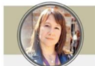
Andrea Arias Vega

Actual diputada del PPD por el distrito 22, es desde el 11 de marzo de 2018 la primera mujer en representar a la Región en la Cámara de Diputados. Fue concejala por Angol y gobernadora de la provincia de Malleco desde el 14 de marzo de 2014 durante el gobierno de Michelle Bachelet.