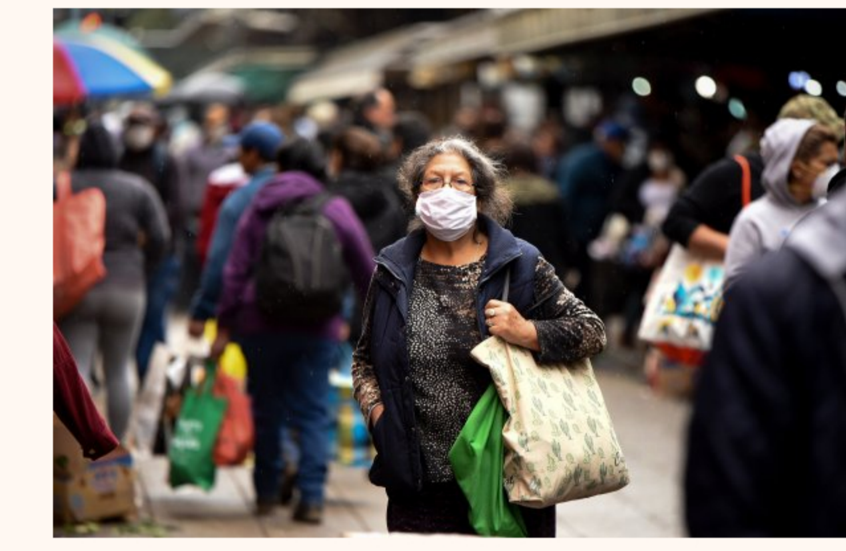
Mientras los temuquenses iban a las ferias libres, en Santiago el ministro Mañalich anunciaba cifras desalentadoras para la región.