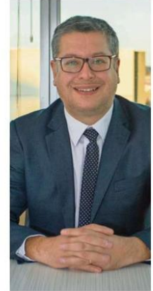
ROBERTO NEIRA, ALCALDE ELECTO DE TEMUCO.

Esta entrevista inaugura un nuevo formato de los Encuentros Online 2021 de la corporación, diálogos que buscarán dar a conocer el perfil y visión de destacados invitados en diversas áreas o especialidades. La cita es hoy a las 18 horas