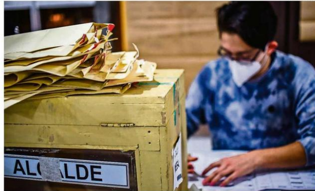
CHOLCHOL TUVO LA PARTICIPACIÓN MÁS ALTA DE LA REGIÓN, MIENTRAS QUE CURACAUTÍN REGISTRÓ LA MÍNIMA.

De hecho este 40,1% de participación en el Plebiscito fue el segundo más bajo a nivel nacional en octubre de 2020, sin embargo, en esta oportunidad hubo cuatro regiones que tuvieron una participación menor a la de La Araucanía.