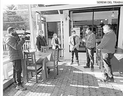
LAS AUTORIDADES ABORDARON LOS ALCANCES DEL NUEVO SEGURO OBLIGATORIO PARA LOS TRABAJADORES FRENTE AL COVID-19.

APORTE. Cartera del Trabajo y Previsión Social abordó el tema.