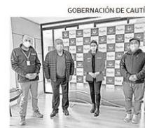
CAMPAÑA SE LANZÓ EN PUCÓN.