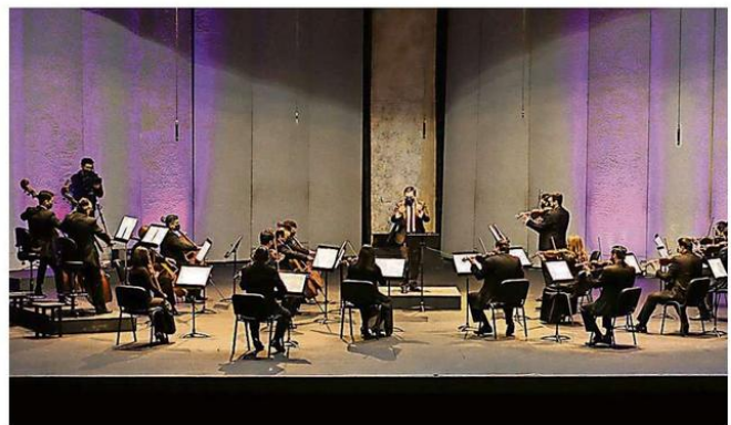
LA ORQUESTA FILARMÓNICA DE TEMUCO RETORNA A LOS CONCIERTOS CON PÚBLICO PRESENTE.