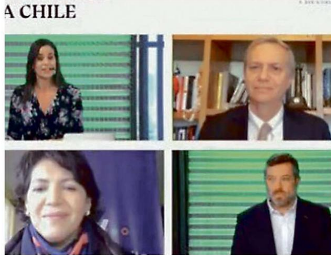
TRES CANDIDATOS PARTICIPARON DEL CONVERSATORIO.

Uno de los principales temas del debate fue la seguridad y la violencia que se viven en la Re-