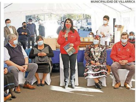
EL TEXTO ESTÁ CONFORMADO POR RELATOS DE MUJERES MAPUCHES, TODAS EMPRENDEDORAS DE LA ARAUCANÍA, DEDICADAS A RESCATAR Y PONER EN VALOR UNA SERIE DE ALIMENTOS Y PREPARACIONES ANCESTRALES.

Entre estos dos candidatos se dio un intercambio de opinión luego de que la senadora señalara que se debe dar "un diálogo sin exclusiones" indicando que "es como que en Colombia no se hubiera dialogado con las FARC". Ante eso, el aspirante de la centroderecha le advirtió que sus dichos "no se podían dejar pasar" y que con eso entonces "reconoce que hay terrorismo" en La Araucanía.