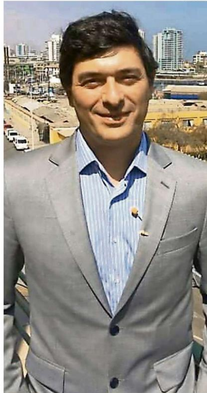
EL CANDIDATO FRANCO PARISI SERÁ ENTREVISTADO HOY Y SE ABORDARÁN TEMAS DE LA CONTINGENCIA REGIONAL Y NACIONAL.