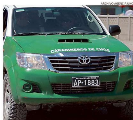
VILLARRICENSE FUE BALEADO CUANDO ESTABA EN SU DOMICILIO.

La Fiscalía espera formalizarlo durante el día viernes.