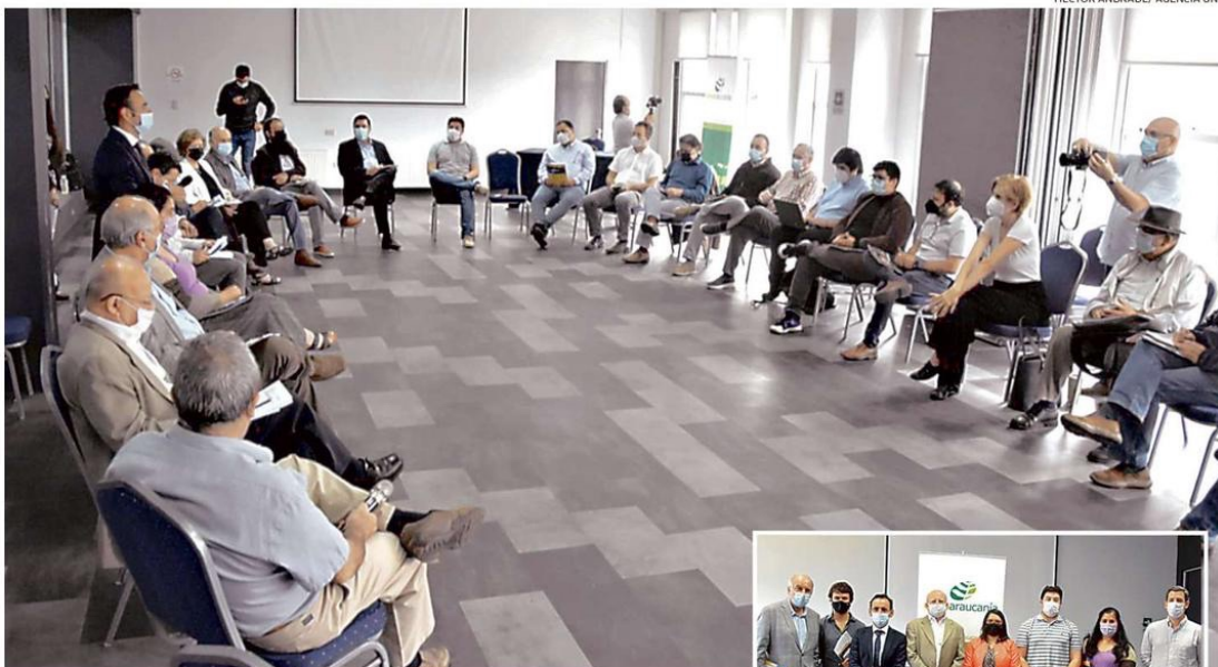
HÉCTOR ANDRADE/ AGENCIA UNO

Curarrehue. Video podría determinar si hubo intencionalidad en incendio en templo construido por el Padre Pancho. Pág. 5