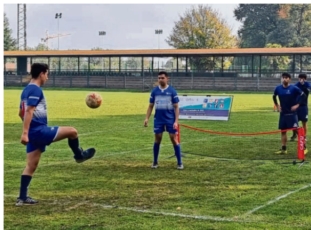
CON ENCUENTROS DE TENIS-FÚTBOL SE PUSO EN MARCHA LA COMPETENCIA UNIVERSITARIA.

“Después de la ceremonia de lanzamiento de este evento empezamos con las competencias. El programa partió con actividades de tenis-fút-