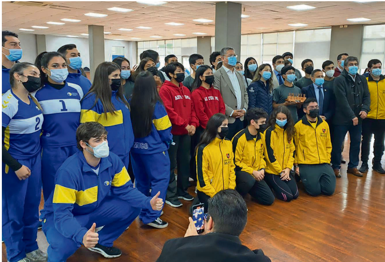
EN LA CEREMONIA DE LANZAMIENTO DE LOS JUEGOS TEMUCO UNIVERCIUDAD PARTICIPARON DEPORTISTAS Y AUTORIDADES.

Las disciplinas consideradas son las de vóleybol, fútbol siete, hockey sobre césped, básquetbol 3x3, tenis, taca taca, ajedrez y crossfit, todas con la participación de damas y varones.