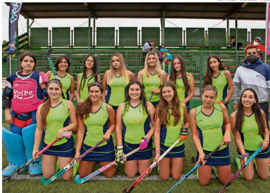
EL PLANTEL FEMENINO DE DESARROLLO DE KOLBE DISPUTARÁ DOS ENCUENTROS EN CONCEPCIÓN.

El programa para el club se cerrará el domingo con otros dos partidos. A las 9 horas, su plantel masculino se verá las caras con la Pontificia Universidad Católica de Valparaíso y a las 11 horas, su equipo femenino adulto enfrentará a Concepción Country Club. Ambos compromisos se jugarán en la cancha del Club Alemán de Concepción.