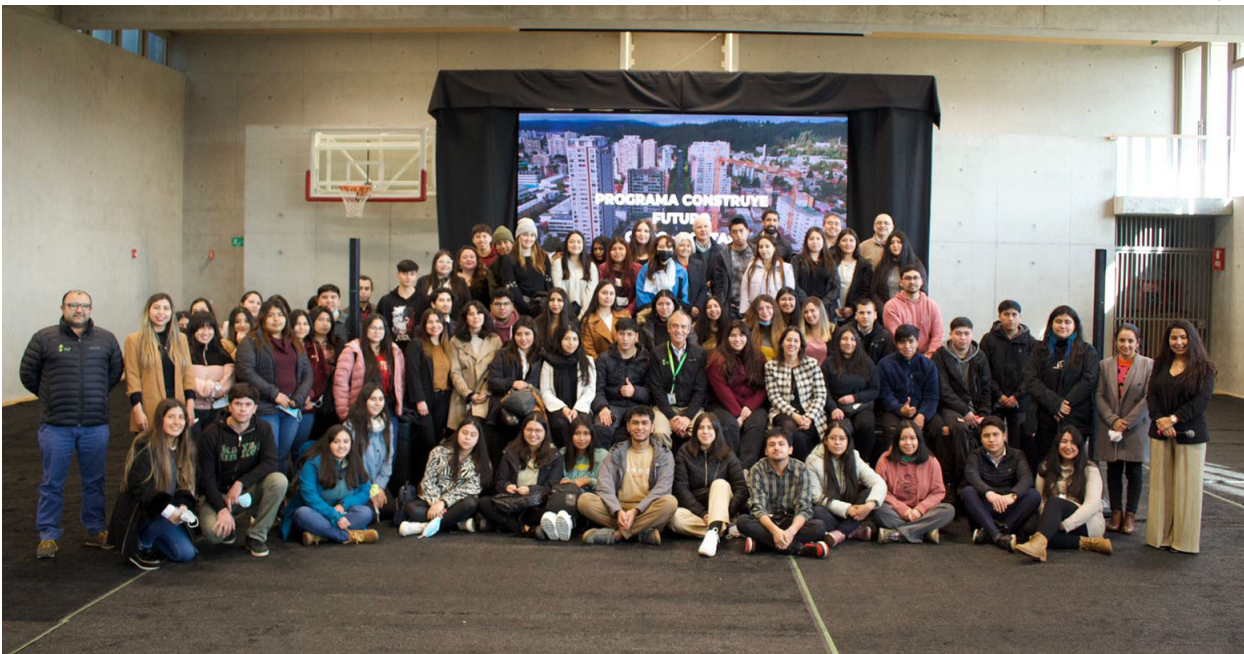
EL PRIMER ENCUENTRO DEL PROGRAMA CONSTRUYE FUTURO CMPC-PORTAS CONGREGÓ A ESTUDIANTES DE PREGRADO BENEFICIADOS.

600 BENEFICIADOS. Perseverancia, capacidad de adaptación y el rol que tiene cada uno para construir su futuro, fue el foco del primer encuentro del Programa Construye Futuro.