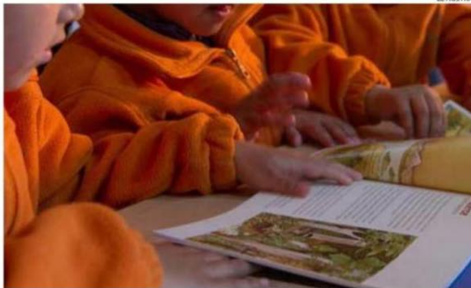
LA TUTORÍA SE ENFOCA EN EL LOGRO DEL APRENDIZAJE LECTOR Y ASESORÍA A FAMILIAS.

gro del aprendizaje lector y asesoría a familias, las que en muchos de los casos no manejaban información sobre las dificultades de sus hijos para aprender, por lo que el vínculo generado con los profesionales fue fundamental para consolidar aprendizajes. “Mi hijo se sintió bien aprendiendo, tuvo bastante